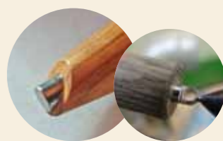
Easy mit Magnet und Öse

Die kompakte Edelstahlspitze (Ø 10 mm) für unsere Kugelschreiberbausätze mit feststehender Mine