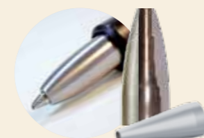
dns-Schreibgeräte-spitzen aus Edelstahl

Die mehrfach abgestuften Spitzen der dns-TWISTER ermöglichen die Herstellung von Schreibgeräten mit eleganten Spitzen und „schlanken“ Schaftdurchmessern.