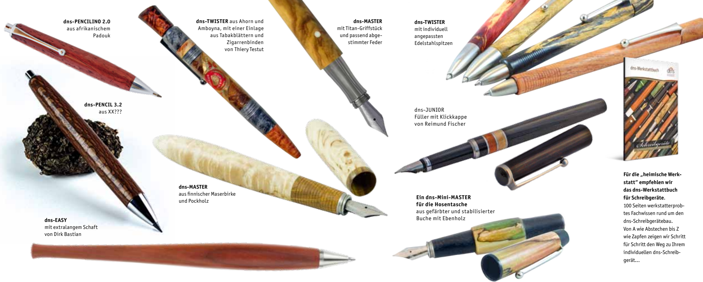
dns-PENCILINO 2.0 aus afrikanischem Padouk

Eine Übersicht über die komplette dns-Schreibgerätefamilie finden Sie online unter: www.drechselstube.de/schreibgeraete