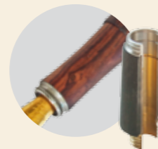
dns-Füllerbausätze für maximale Gestaltungsfreiheit

Das Kappengewinde ist als 2-gängiges Trapezfeingewinde ausgelegt und erlaubt ein Öffnen und Schließen der Kappe mit nur einer Drehung, ohne nachzufassen.