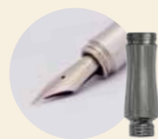
dns-Füllerbausätze mit Edelstahl- oder Titangriffstück und passender Feder

Unser dns-Master ist der einzige Füllerbausatz am Markt, bei dem Sie auch das Griffstück selbst gestalten und mit Holz oder einem anderen Werkstoff verkleiden können.