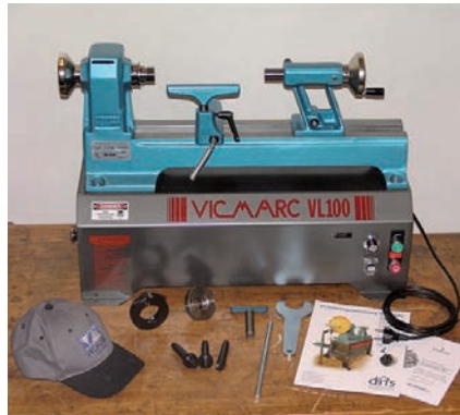
Die „neue“ VL100 el von Vicmarc. Nach Anregungen des DrechslerMagazins wurde trotz des guten Testergebnisses nachgebessert.

Unsere Zeitschrift wird also auch von internationalen Herstellern ernstgenommen und so können wir für unsere Leser die Qualität von Produkten beeinflussen. Herzlichen Dank nach Australien.