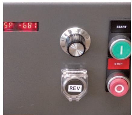
Der Linkslauf (Minus im Display) wird nun durch einen Sicherheitsschalter betätigt.