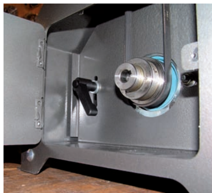
Eine wesentlich größere Tür erleichtert nun die zusätzliche Möglichkeit der Riemenverstellung.